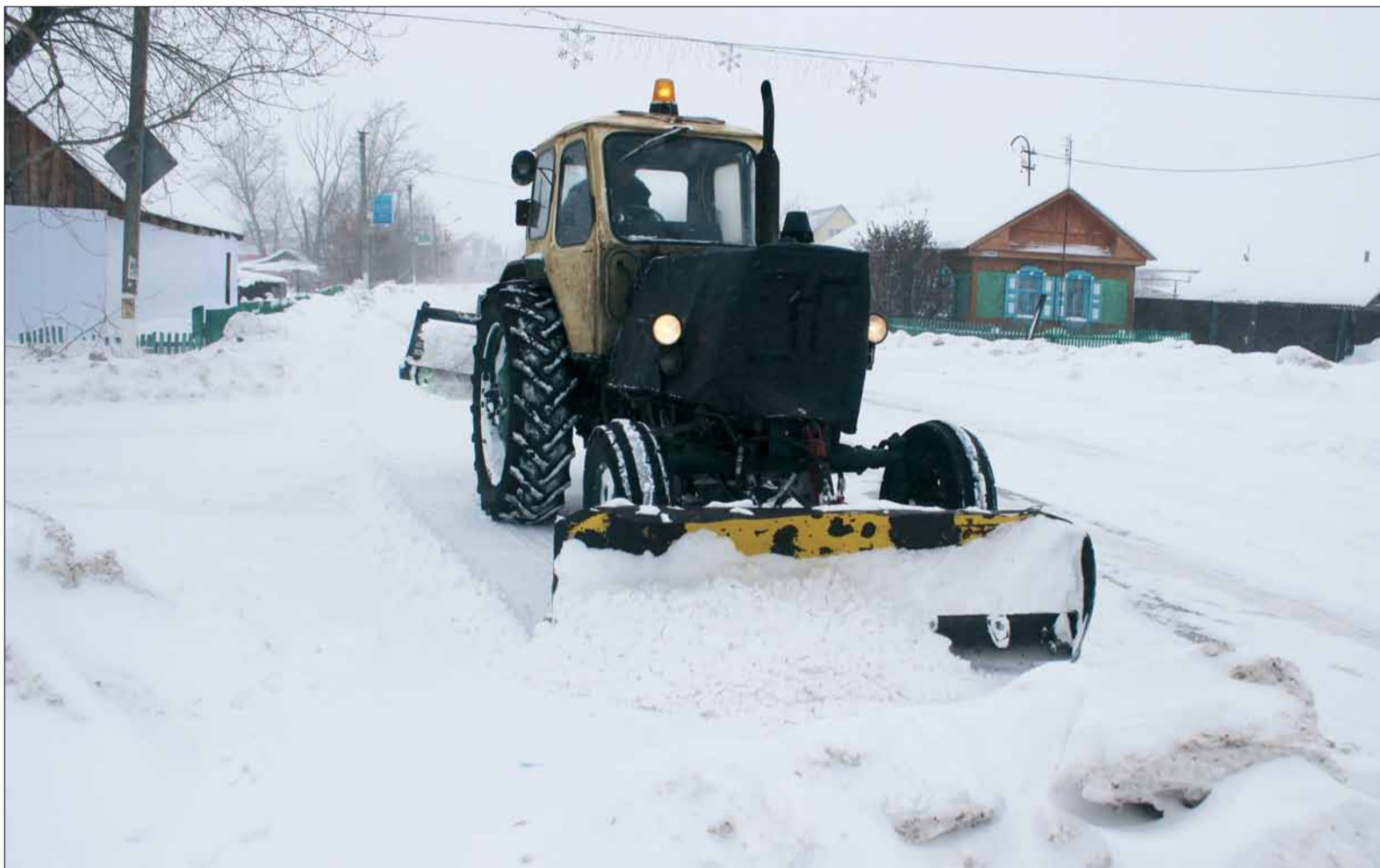
Снегопады вынуждают дорожные и коммунальные службы района работать в усиленном режиме.

За январь на «горячую линию» муниципальных районов и городских округов обратились более 740 человек. В министерство социальных отношений области по данному вопросу поступил 131 телефонный звонок.